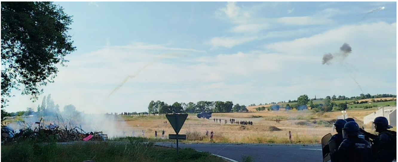
Un mortier d'artifice tiré depuis la barricade

Les gendarmes tentent de s'approcher « discrètement » de la barricade et des pierres sont lancées dans leur direction ; puis, à 19 heures 13 , les observateur-es constatent, en provenance de la barricade, plusieurs tirs de mortier d'artifice.