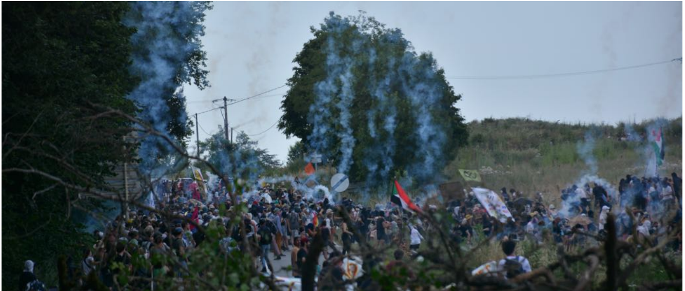
17 heures 42 – Pluie de grenades lacrymogènes au cœur de la manifestation

18 heures 00 – La situation est plus calme.