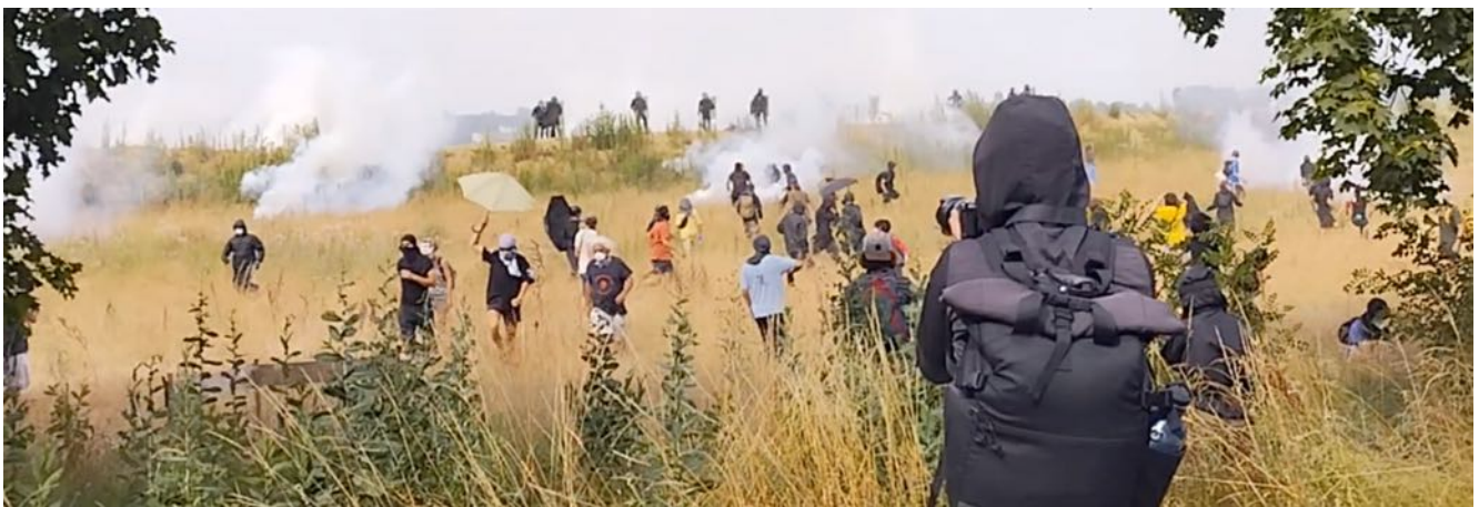
Grenadages vus depuis la nationale