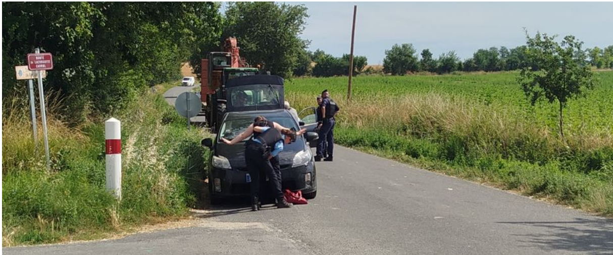
5 juillet – 11 heures 09 – Fouille au corps

3 jeunes femmes se sont rapprochées des observateur-es pour relater leurs témoignages à l'oral et à l'écrit.