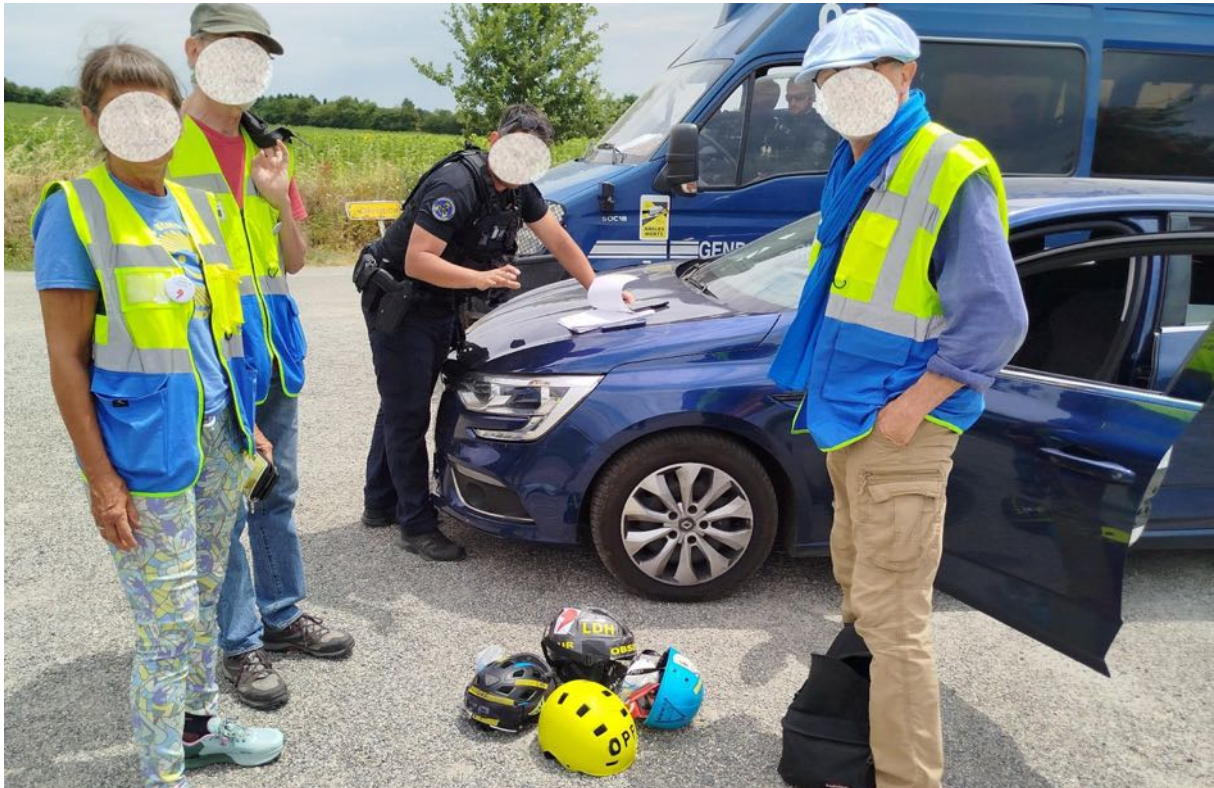
Saisie des EPI des observateur-es le 6 juillet

Manifestement, par rapport à la veille, la cohérence dans les ordres transmis semble avoir été rétablie et le mot d'ordre général est de ne pas laisser les EPI aux observateur-es.