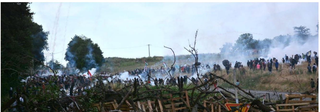
37 grenades lacrymogènes sont tirées en quelques instants de manière indifférenciée dans le champ situé entre la nationale et le chantier de l'A69 et au milieu des manifestant-es rassemblé-es sur la nationale.

En effet, la centaine de grenades tirées, principalement des CM6, contiennent 6 palets lacrymogènes, couvrant chacun 800 m 2 . Vu le nombre de manifestant-es, environ 750, cela équivaut à quasiment un palet par personne.