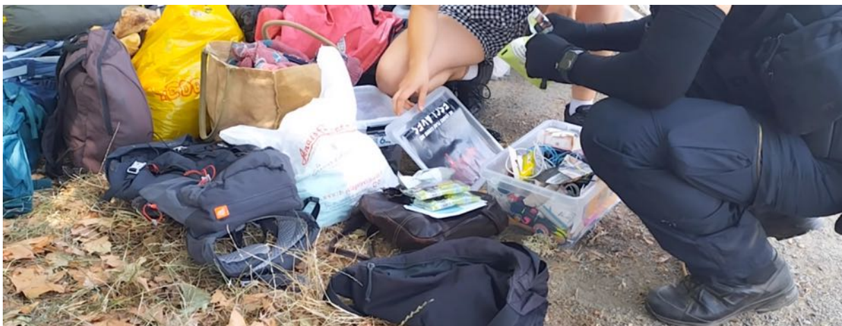
Les gendarmes vont jusqu'à fouiller les paquets de tabac. Le tabac, une arme par destination... ?

Conformément aux règles en vigueur, des fouilles au corps concernant les femmes sont réalisées par des femmes gendarmes. Des témoignages relatent cependant des fouilles particulièrement intrusives, exécutées sans le respect de l'intimité des personnes et vécues comme traumatisantes par les personnes concernées.