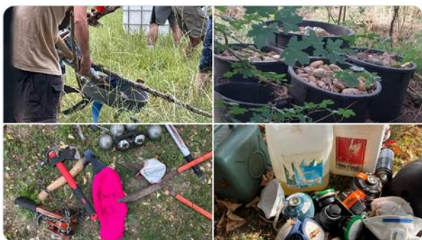
12:56 PM · 5 juil. 2025 · 273,9 k vues

Les Français doivent savoir que l'État ne fait pas face à des militants de la cause écologique, mais à des groupes de barbares sans limite qui veulent créer le chaos et s'en prendre aux forces de l'ordre, malgré les décisions de justice qui ont permis la construction de l'A69. Nous ne laisserons rien passer.