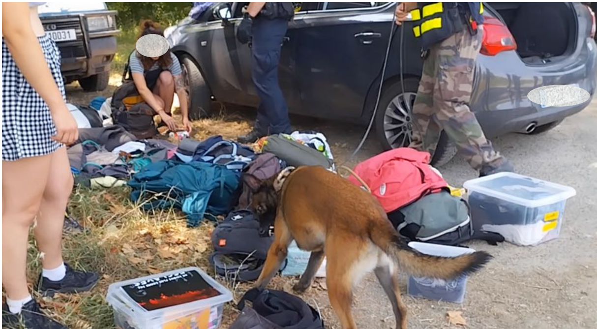
4 juillet – 13 heures 34 – Fouille complète d'un véhicule à l'entrée du site du château de Scopont avec intervention de la brigade cynophile.

5 juillet – 11 heures 02. Des manifestant-es arrivent eux et elles aussi et sont systématiquement fouillé-es. Les fouilles observées par les membres de l'observatoire étaient systématiques. Les véhicules étaient stoppés, les personnes devaient présenter leurs papiers, fournir leur identité, ouvrir leur coffre et leur sac. Il était demandé de vider l'intégralité des effets (y compris les plus intimes), des tentes et sacs de couchage.