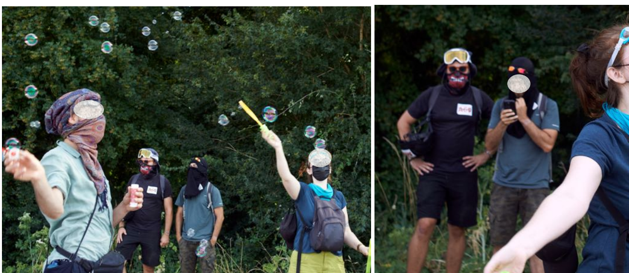
Leur présence était avérée dans la manifestation. – Images extraites de photos