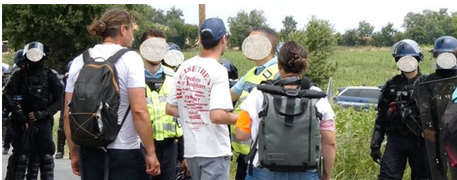
Négociations pour laisser passer une batucada