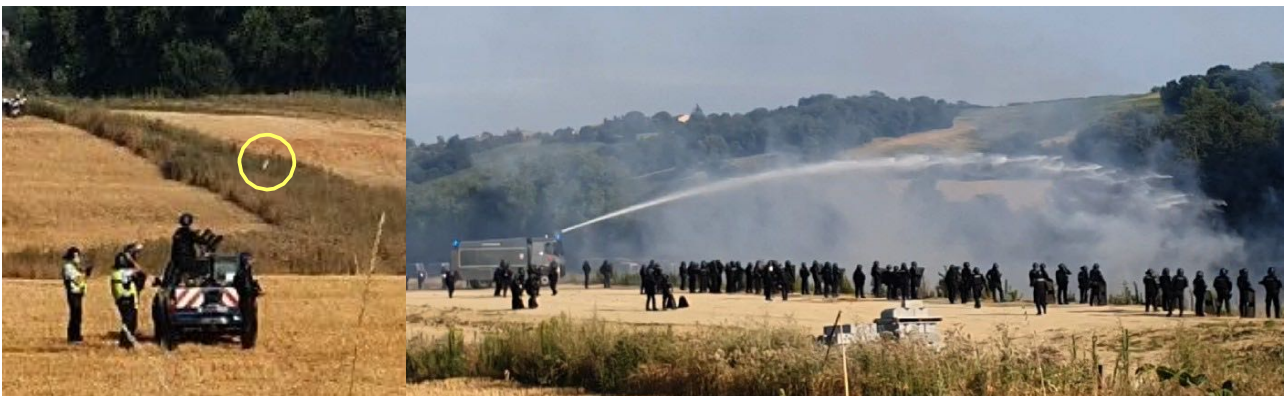
Le camion lanceur d'eau intervient au préalable pour humidifier le sol, puis c'est au lanceur de grenades multicoups d'entrer en action. Une des grenades tirées en une fraction de seconde est visible sur l'image.

Les observateur·es ont notamment assisté à l'utilisation du lanceur multicoups de 56 mm positionné sur un pick-up 26 . Cette nouvelle arme au tarif de 16 000 € pièce avait été achetée en urgence pour servir en Nouvelle-Calédonie en 2024 et avait été utilisée le 19 juillet 2024, à Migné-Auxances, dans la Vienne, et avait alors été à l'origine d'un incendie d'un champ de 8 hectares ; ce qui avait obligé les manifestant·es à interrompre leur manifestation face au danger que représentait cet important feu de chaume de plusieurs centaines de mètres linéaires par une journée caniculaire. Ce lanceur de grenades propulse 12 grenades par séries de 4 envoyées en une fraction de seconde. Il est classé comme arme de catégorie A2, c'est-à-dire que c'est une « arme de guerre ». Son usage a été conséquent à Scopont car les observateur·es ont constaté qu'il était rechargé à plusieurs reprises. Ce samedi 5 juillet 2025, le camion lanceur d'eau n'a pas servi pour éteindre le départ de feu de 17 heures 32 mais a été utilisé à 19 heures 35 en prévision des tirs de grenades notamment avec ce multicoups et avec le blindé Centaure. Il a humidifié le sol et évité de nouveaux départs de feu.