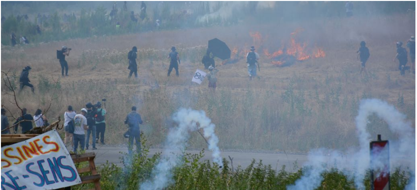
Début d'incendie généré par les palets des grenades lacrymogènes