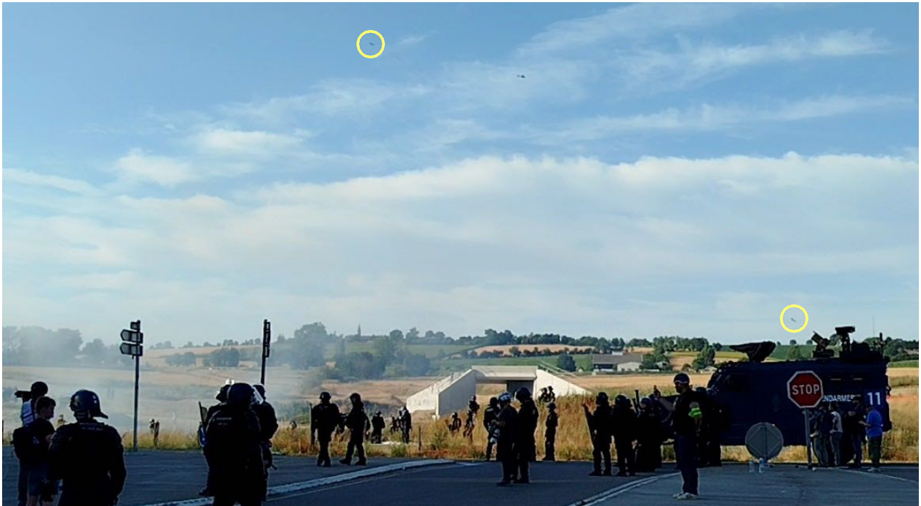
2 grenades sont lancées coup sur coup depuis le Centaure