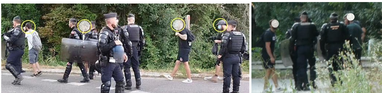
4 individus, visages masqués, sortent du bois et sont contrôlés par les gendarmes puis partent tranquillement en discutant avec les gendarmes...

Pour les observateur-es, il ne fait alors plus aucun doute que ces hommes appartiennent à des services de renseignements. Après recherches dans les heures qui suivent, leur présence a été constatée à 15 heures 41 durant l'assemblée devant le château et à 18 heures 25 à quelques mètres de la barricade.