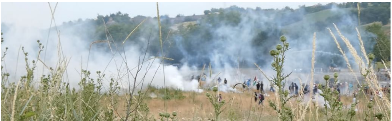
Grenadages vus depuis les terrassements du tracé autoroutier

Sur la base de l'écoute des bandes-son des vidéos prises par les observateur-es, ce sont plusieurs dizaines de grenades lacrymogènes qui, en quelques minutes, seront lancées au Cougar, à la main ou bien par le pick-up doté d'un lanceur multicoups. Les observateur-es avaient déjà constaté la présence de cette nouvelle arme en juillet 2024 à Migné-Auxange (à côté de Poitiers) lors de la manifestation contre les mégabassines. Ce sont les grenades de ce pick-up qui ont mis en feu un champ de chaumes et avait obligé les manifestant-es à faire demi-tour eu égard au danger représenté par cet incendie 24 .