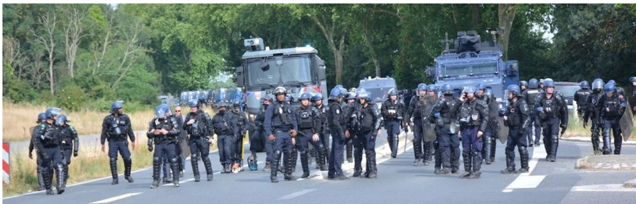
Des centaines de gendarmes casqué·es et toute la panoplie d'armement, ici blindé Centaure et canon à eau, étaient disponibles pour la « Turboteuf »

On peut donc clairement parler ici d'une disproportion du nombre de militaires présent·es au vu de cette manifestation.