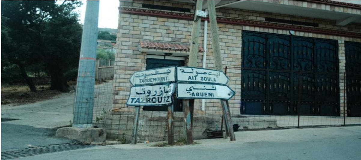
Pancartes villages, en juin 2025.

Mais Bernard Montagne donne une explication à cette violence extrême : « C'étaient des tirailleurs sénégalais. Il y a eu un tué, ensuite la compagnie s'est lancée dans une opération de représailles. Ils se sont vengés sur la population, allez-y, vengez-vous, c'était facile. » Il décrit des régiments sous commandement de sous-officiers endurcis par l'Indochine, pour qui les « représailles » étaient une norme, et des soldats pour qui l'argent, plus que la France, était la motivation selon lui.