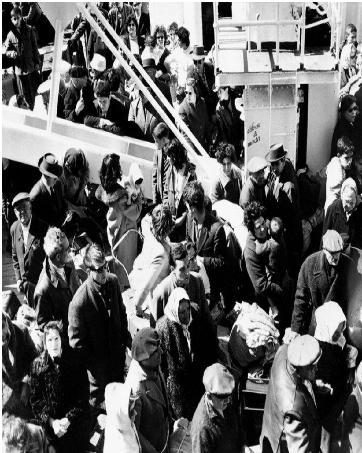
Une foule d'arrivants d'Algérie à bord du bateau « Ville d'Oran » débarque à Marseille le 25 mai 1962.

aller à l'aéroport et ramener des gens harassés, avec des valises, qui pleuraient. [...] On avait un cabanon dans la cour et on mettait des sortes de tapis pour qu'ils puissent dormir ».