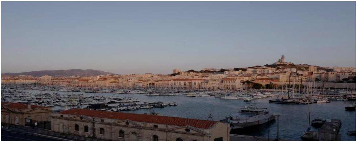
Le Vieux-Port de Marseille en juin 2025.

L'installation de ces populations du Maghreb entraîne aussi une visibilisation de la judéité à Marseille. Elles ont une identité juive plus assumée, là où les personnes déjà présentes ne s'affichaient pas comme telles dans la sphère publique.