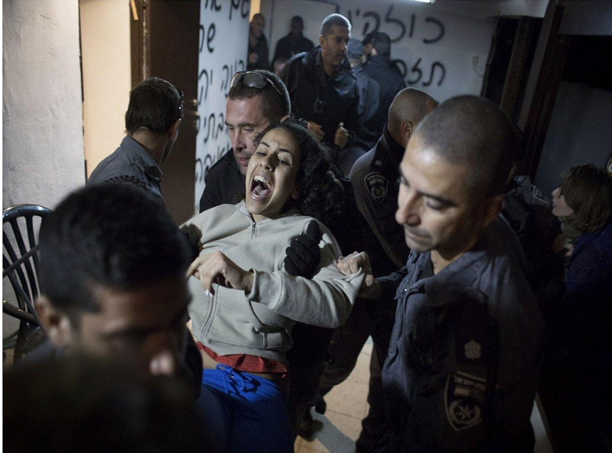
Des policiers israéliens arrêtent un activiste lors de l'expulsion de familles principalement mizrahim du quartier de Givat Amal à Tel Aviv, le 29 décembre 2014.

des années 1950, ainsi que d'autres cas d'abus et de persécution contre les Mizrahim de la part de l'élite sioniste. Pendant des années, elles ont été au centre des efforts visant à mettre fin à l'expulsion de Givat Amal, un quartier ouvrier de Tel-Aviv à prédominance mizrahie ; après 60 ans de batailles juridiques, les habitants ont finalement été expulsés en 2021 pour permettre à des magnats de l'immobilier de construire des appartements haut de gamme.