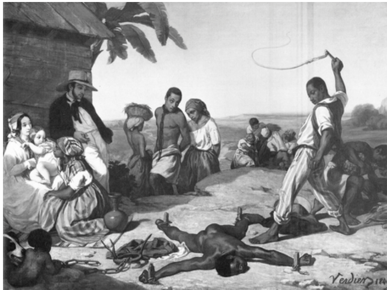
Et Marx d'enchaîner :

C'est sous les tropiques, là même où les profits annuels de la culture égalent souvent le capital entier des plantations, que la vie des nègres est sacrifiée sans le moindre scrupule. C'est l'agriculture de l'Inde occidentale (les Caraïbes F.C.), berceau séculaire de richesses fabuleuses, qui a englouti des millions d'hommes de race africaine. C'est aujourd'hui à Cuba, dont les revenus se comptent par millions, et dont les planteurs sont des nababs, que nous voyons la classe des esclaves non seulement nourrie de la façon la plus grossière et en butte aux vexations les plus acharnées, mais encore détruite directement en grande partie par la longue torture d'un travail excessif et le manque de sommeil et de repos».