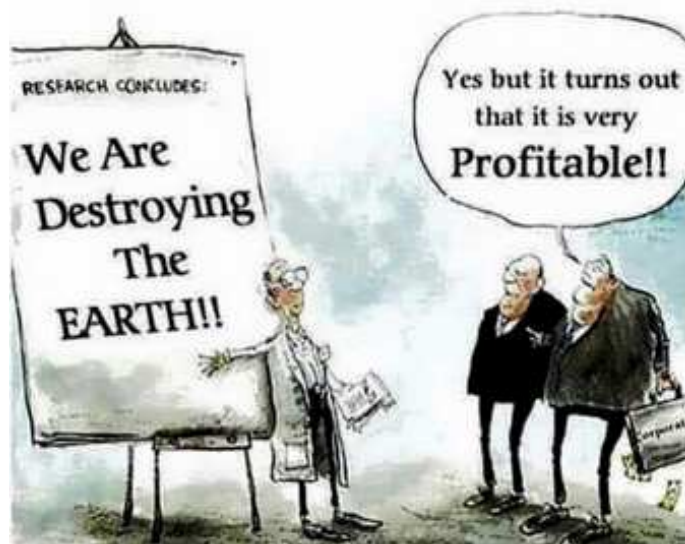
Par François Chesnais

Publié par Alencontre le 5 - août - 2018