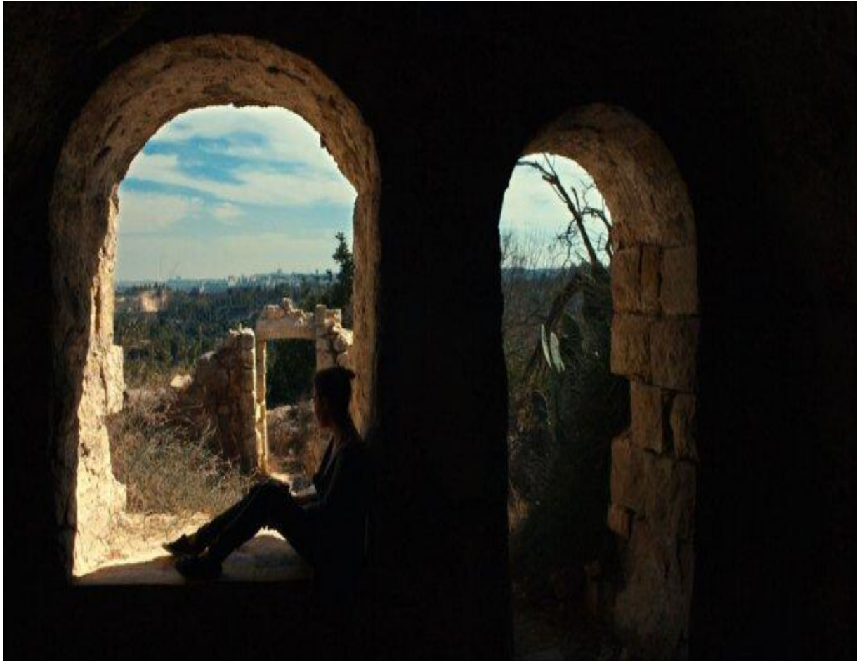
© La boîte bleue de Michal Weits