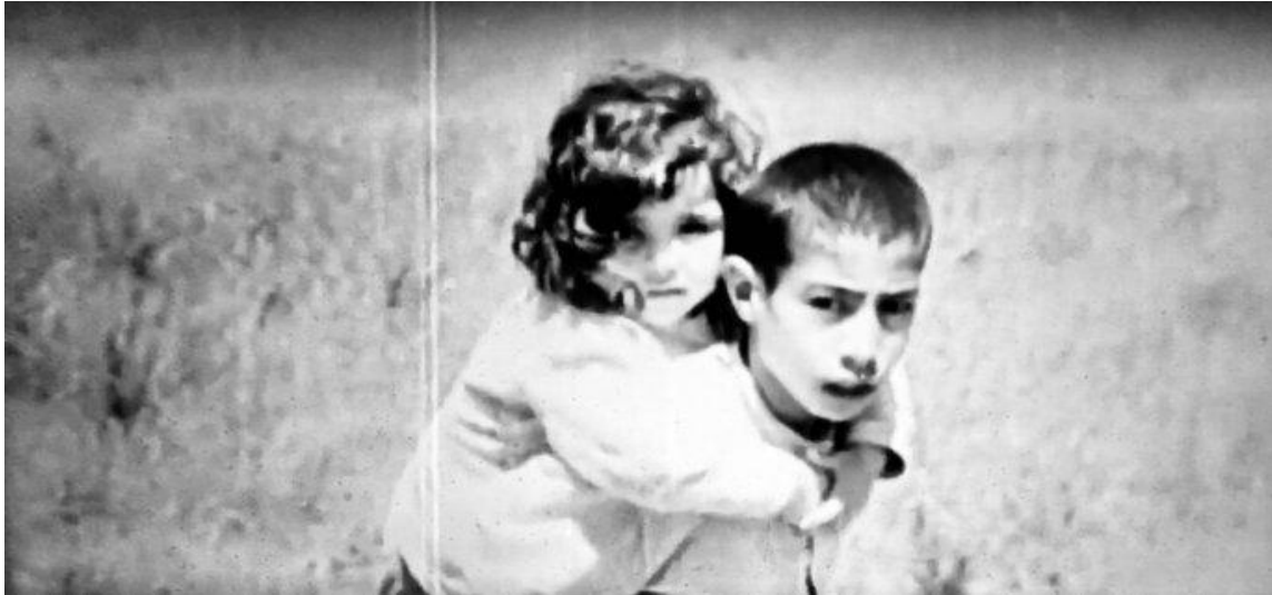
© La boîte bleue de Michal Weits

Son indifférence au peuple palestinien pourrait expliquer la franchise frappante de ses journaux intimes, rédigés sans filtre, avec l'assurance tranquille d'un homme convaincu de la légitimité de la domination de son peuple et de la normalité de ses actes. Son geste de consigner serait alors le prolongement de l'acte colonial. Cependant, l'enregistrement méthodique et sans précaution de ses exploits effroyables étonne. Son témoignage constitue un contre-récit soigneusement enseveli et banni par son État. Ses mémoires contredisent l'Histoire officielle d'Israël, victime innocente. Son archive s'oppose à celle enseignée et racontée à travers le monde.