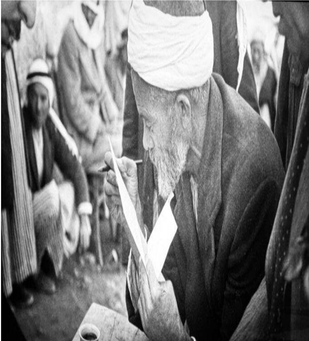
© La boîte bleue de Michal Weits

En 1910, la Palestine comptait 80 000 Juifs et 650 000 Arabes. En 1933, on y recensait 175 000 Juifs et 800 000 Arabes. Joseph Weitz, pilier de la politique foncière sioniste, poursuivait un objectif clair : inverser cette réalité démographique. Il n'achetait pas les terres pour coexister avec les Arabes, mais pour les déposséder méthodiquement : les arracher à leurs terres, à leurs villages, puis les chasser de leur pays. Une stratégie d'expulsion et de remplacement. Ces terres occupées et cultivées depuis des générations par des paysans, appartenaient souvent à de riches propriétaires arabes installés à Beyrouth, au Caire ou à Damas. « Chaque parcelle de terre représentait une terre de plus dans la création d'un État juif. », dit son arrière-petite-fille. Son projet fondateur pour Israël ne faisait aucune place aux Palestiniens qui devaient céder leur patrie à une population exclusivement juive. Le nettoyage ethnique a commencé avant la proclamation de l'État, il n'a jamais cessé et atteint aujourd'hui son acmé funeste.