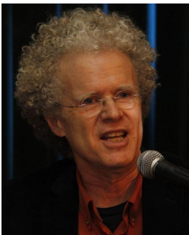
Erik Olin Wright.