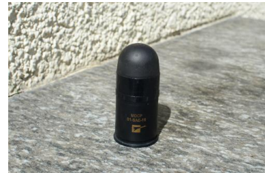
La vulnérabilité des différentes zones du corps face aux tirs de LBD.