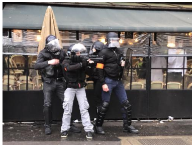
Un exemplaire de la munition de courte portée (MDCP), dite aussi « munition universelle de défense » (MUD), produite par Aseltex.

Attribué en février 2016 à la société Aseltex - groupe Étienne Lacroix, ce marché de 5,5 millions d'euros représentait plusieurs dizaines de milliers de balles en caoutchouc – à 50 euros l'unité en moyenne, cela pourrait représenter jusqu'à 110 000 pièces. Ce stock est venu en premier lieu alimenter les forces de police, la gendarmerie ayant maintenu son choix de la munition américaine CTS. Puis à l'automne 2018, la direction centrale des CRS (DCCRS), jugeant les munitions de courte portée « insuffisamment fiables », a emboîté le pas de la gendarmerie pour revenir à l'usage des munitions CTS.