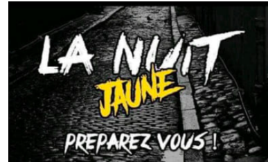
Capture d'écran d'une image partagée par plusieurs gilets jaunes considérés comme faisant parti de la mouvance de l'ultradroite.

On nous a même rapporté « l'effacement » d'un haut cadre du renseignement français quand il a découvert les propos d'Emmanuel Macron. Sur ce sujet non plus l'Élysée n'a pas répondu à nos sollicitations.