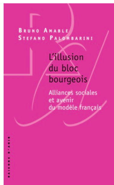
Les Illusions du Bloc Bourgeois, Raison D'Agir, 2017

Interrogés par Mediapart (lire leur entretien complet dans l'onglet Prolonger), ils nuancent : « il y a un populisme à rejeter et un autre populisme probablement nécessaire », affirment-ils. Selon eux, « l'opposition efficace au bloc bourgeois [celui qui soutient l'évolution vers un modèle néolibéral, ndlr] doit se construire sur les thèmes liés à la relation salariale et à la protection sociale : il faut donc rejeter le populisme qui remplacerait purement et simplement les clivages engendrés par l'organisation de la production avec d'autres, comme par exemple celui entre « le peuple » et « les élites ». Cette forme de populisme est celle qui, en Italie, a conduit à l'alliance entre Ligue et 5étoiles, qui ont dans leur programme de gouvernement la lutte contre le précaire mais aussi la flat tax, c'est-à-dire une réduction des impôts concentrée principalement sur les revenus les plus hauts ».