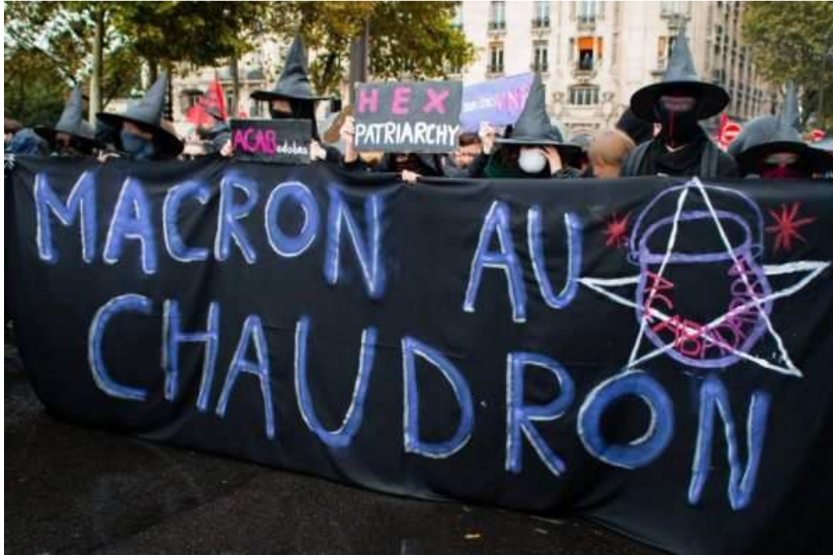
Ambiance sorcellerie en tête de cortège le 12 septembre à Paris