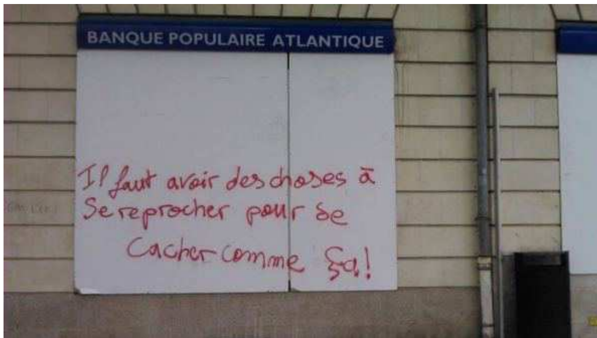
Mouvement contre la loi travail, 2016

Contrairement à ce qui est élucubr  par les m dias, la casse est  minemment s lective. Elle vise g n ralement :