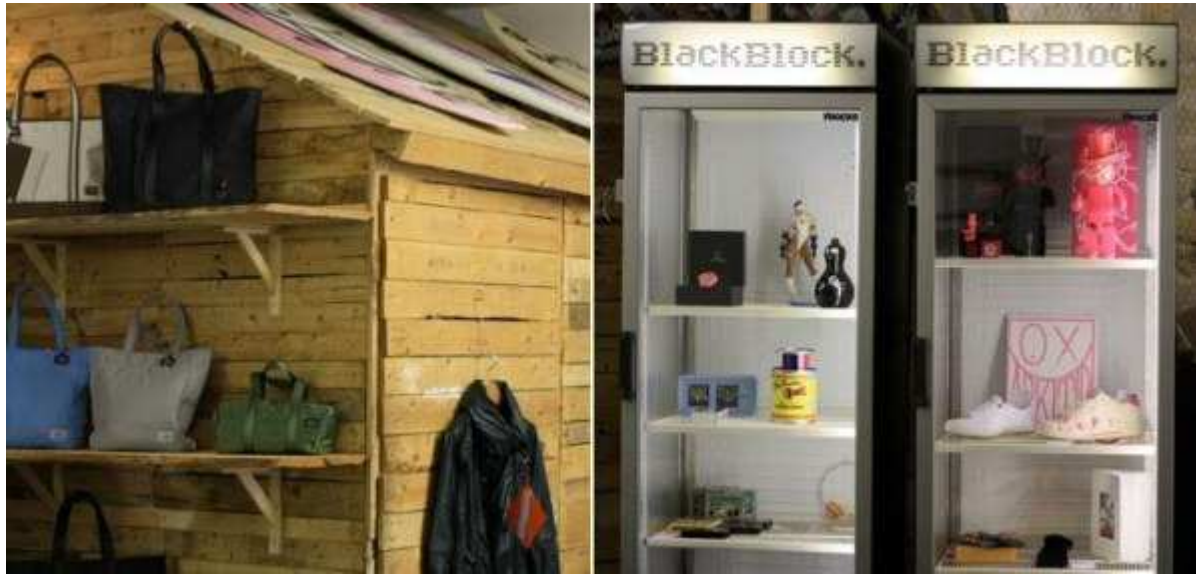
L'infâme boutique « BlackBlock » au Palais de Tokyo

d'excellence s'il n'y avait pas eu d'escrocs ? [...] Le jour où le Mal disparaîtra, la Société en serait gâtée, si même elle ne disparaît pas !